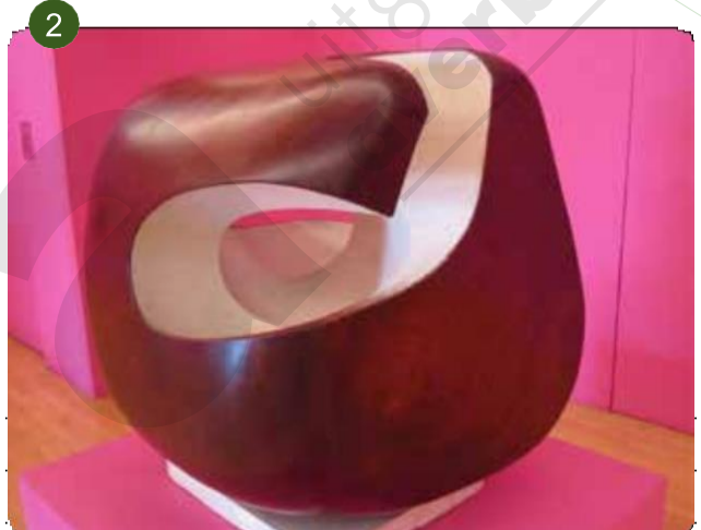
Barbara Hepworth, Corinthos, 1954-1955

We onderscheiden twee soorten vormen: geometrische en organische, biomorfe vormen .