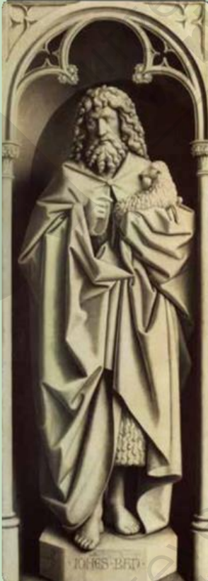
Hubert Van Eyck, Johannes de Doper, Detail van de gesloten panelen van het Lam Gods, 1430-1432