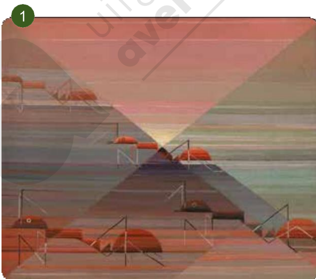
Felix de Boeck, Mieren (Genesis), 1923