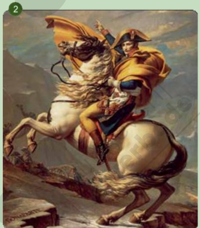
Jacques-Louis David, Napoleon steekt de Alpen over, 1801