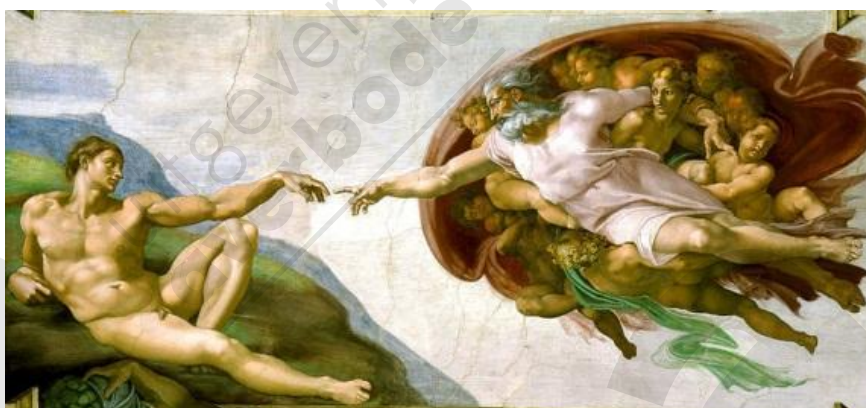
Michelangelo, De schepping van Adam, 1511