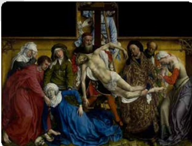
Rogier van der Weyden, De kruisafneming, 1435-1438

Rogier van der Weyden (1399/1400-1464) was een van de Vlaamse Primitieven. Die kunstschilders waren de eersten om te werken met olieverf op een houten paneel. Ze waren tijdens de 15e eeuw actief in Gent, Brugge, Leuven, Doornik en Brussel. Hun gedetailleerde stijl om de werkelijkheid weer te geven was erg vernieuwend. De olieverf zorgde voor reflectie van het licht in de verflagen en liet ook toe om heel gedetailleerd te werk te gaan.