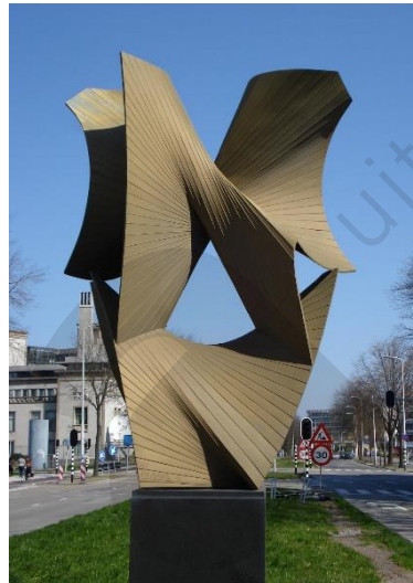
Antoine Pevsner, Construction dans la troisième et la quatrième dimension , 1969, Den Haag