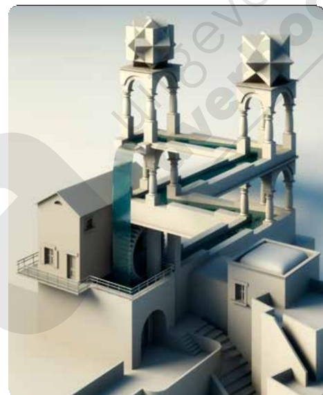
Reproductie van M.C. Escher, De waterval

Escher weet de perspectiefregels zelfs zo toe te passen, dat hij ons op het verkeerde been zet. Hij doet dat door de onmogelijke driebalk toe te passen, een principe dat in de wiskunde niet realiseerbaar is. Gelukkig kan dat in de kunst wel.