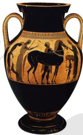
Oud-Griekse amfoor van de hand van Exekias, 540 – 530 vóór Christus, Vaticaanmuseum.