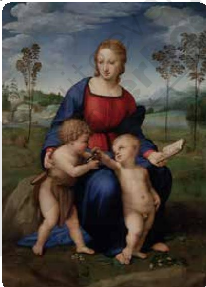
Rafael, Madonna met de distelvink, 1506