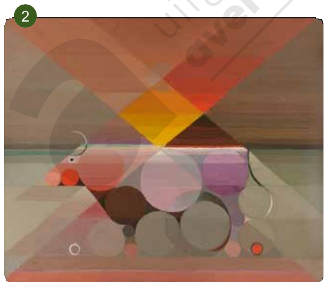
Felix de Boeck, De stier (Genesis), 1923