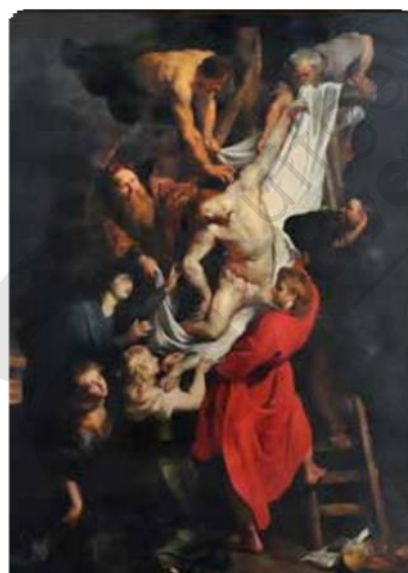
Pieter Paul Rubens, De kruisafneming, fragment, 1611-1614