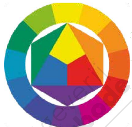
Johannes Itten, Kleurencirkel, 1961

De secundaire kleuren ontstaan door twee van de drie primaire kleuren in gelijke hoeveelheden met elkaar te mengen.